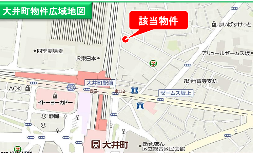
大井町物件広域地図